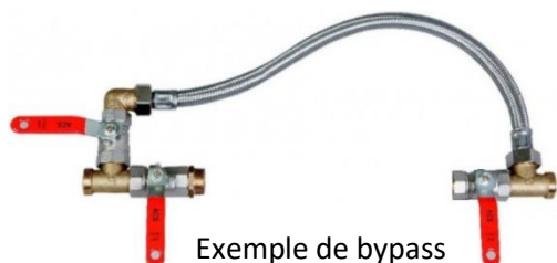
Exemple de by-pass

Le système de filtration/vitalisation de l'eau AMILO modèle Compact+ est composé de 2 porte-filtres imprégnés à l'argent.